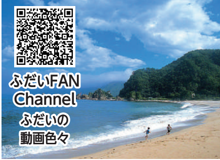
ふだいFAN Channel ふだいの動画色々