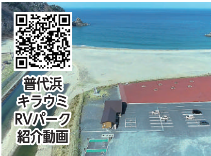
普代浜キラウミRVパーク紹介動画 普代浜キラウミRVパーク(3台分)