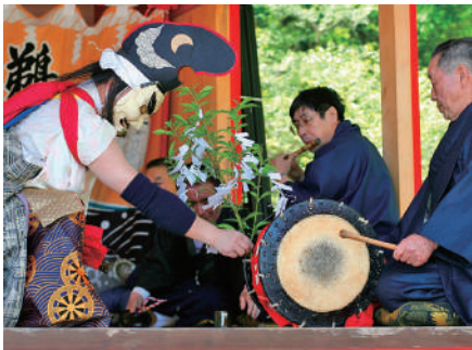
国の重要無形民俗文化財「鵜鳥神楽」