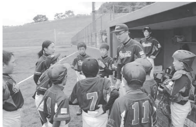
日々の練習で汗を流す普代オーシャンズ

そこで、現在具体的に分かっている点について伺う。また、人命を第一に考えていち早く村民に知らせるべきと考えるが、いつごろどのような周知をするのか伺う。