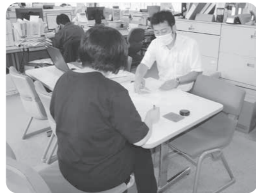
地域商品券給付の様子