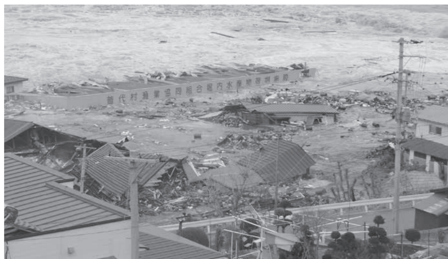
最悪の事態にならないよう備えたい