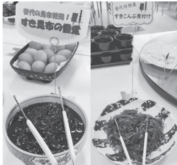
くろさき荘で提供している「すき昆布の佃煮・煮付け」

回り、人口減少に歯止めがきかない状況となっている中、株式会社アースカラーさんが、村に多くの移住者呼び込んでいるが、問題となっているのは住居を探すのが大変だと聞いている。そこで、村として空き家バンクの活用、新築でのア