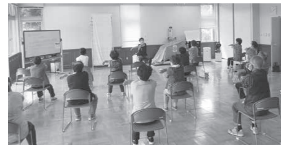
保健センターで行われている高齢者活動の様子

や機械化により、本村農業の近代化、そして飛躍的発展などを期したもので、先々に有益な開発農地と認識・期待している。