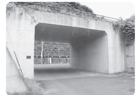
普代駅裏の線路下カルバートに設置予定