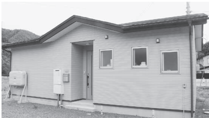
移住者にも貸し出している村営住宅

証屋村長 移住者の住居確保については、これまで空き家を買取り、村営住宅として、移住者に貸し出すところだ