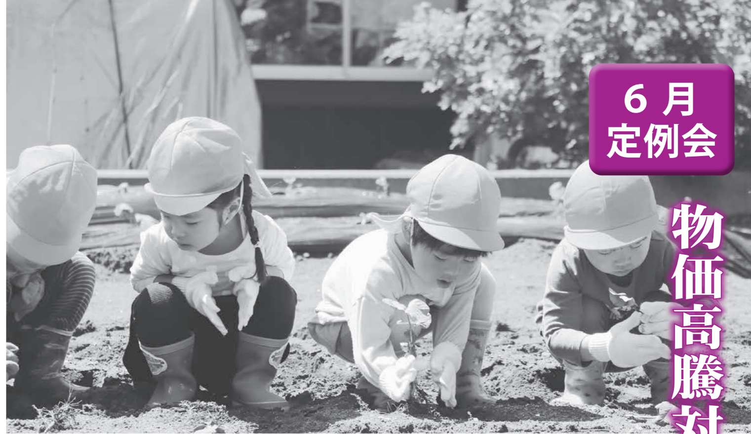
いわて子育て世帯臨時特別支援金は「子育て世帯」を応援します

生まで対象を拡充します。 物価高騰対策地域商品券給付事業は、物価高騰のあおりを受ける全村民に対し、1人あたり1万円分の地域商品券を交付するもので、物価高騰対策並びに地域経済循環を図ることを目的とした事業です。