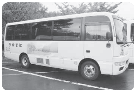
修繕予定のはまゆり号

問 修繕するバスはどのくらい乗っているか。また、修繕または新規購入ではどちらがいいのか、教育長の考えを伺う。