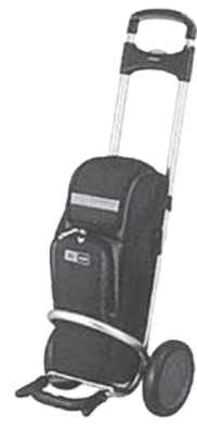
酸素濃縮装置の専用バッグ&amp;カート

在宅酸素濃縮装置というもので、酸素ボンベと口につながチューブ、酸素ボンベを入れて押して歩くものなど一式の装置である。該当者は1名で、月々4万2,900円ほど。期間は6月～3月まで借り上げるものである。