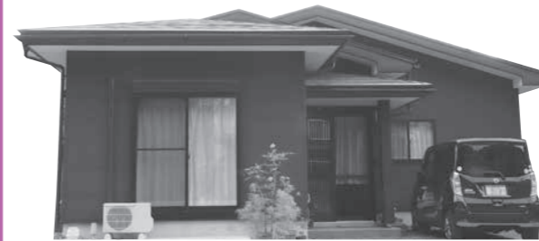
支援金を活用して再建された住宅

心のケアを含めて保健師も同行しながら生活再建についての意向確認・生活の状況把握等を行っている。