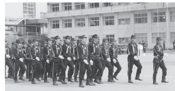
村消防団員による特別訓練の様子