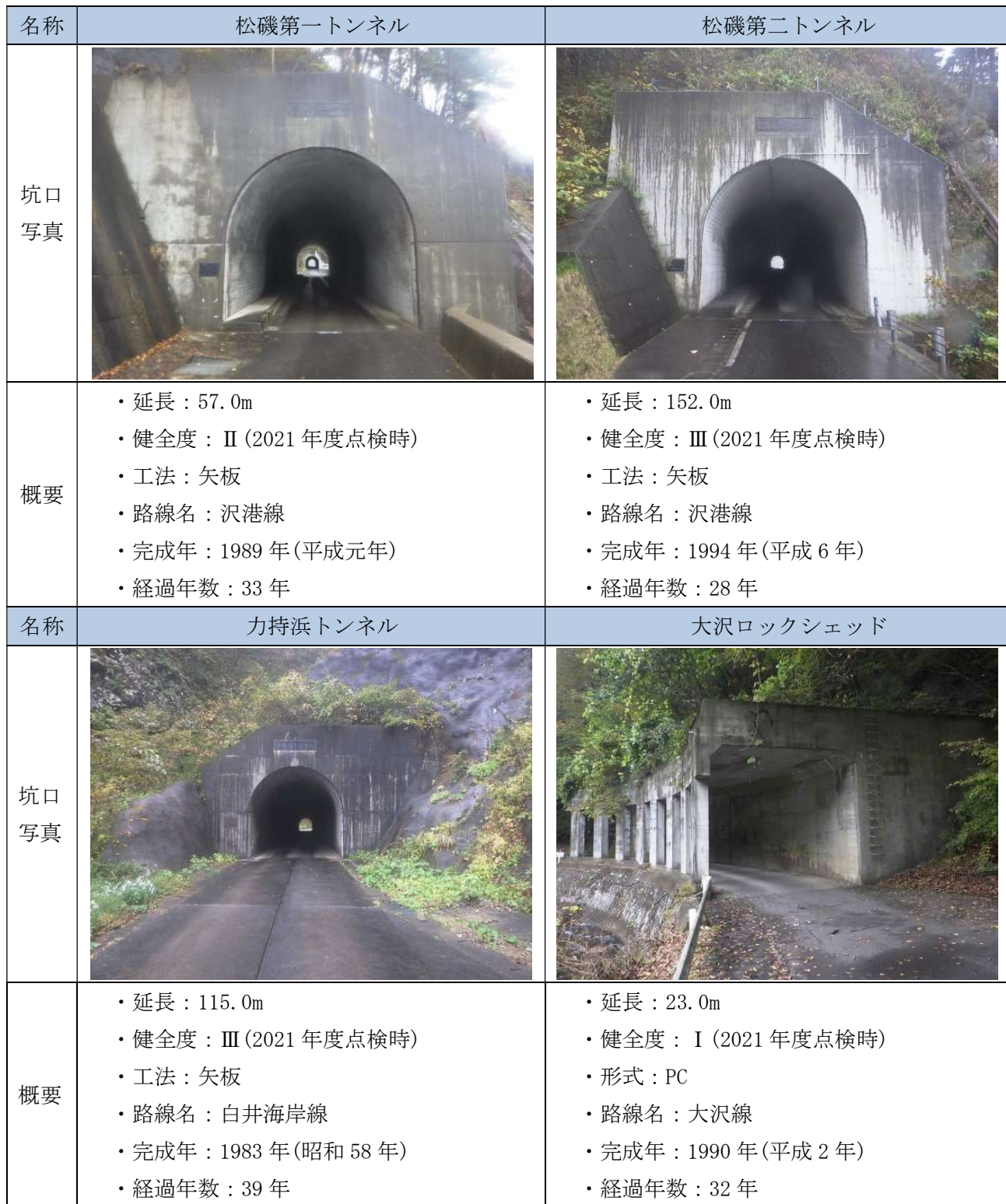
表 1.3 トンネルおよびシェッドの諸元および直近の点検結果

普代村が管理する施設は、道路トンネルが3施設、ロックシェッドが1施設の計4施設で、建設後、28年～39年（令和4年現在）が経過している状況です。