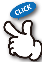
「風しんの抗体検査・予防接種を！」動画