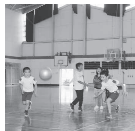
放課後子ども教室

村グローバルアップ事業における、中学生海外派遣事業と追手門学院大学への小学5年生派遣事業についての村の見解は。