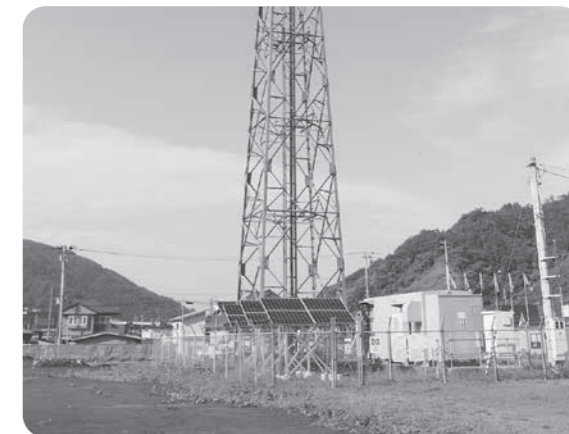
NTTへ貸し出ししている土地

緑区のNTTへの土地貸付分50万円と、そのほかは、建設業者等に用地等を貸し出した分が計上されている。