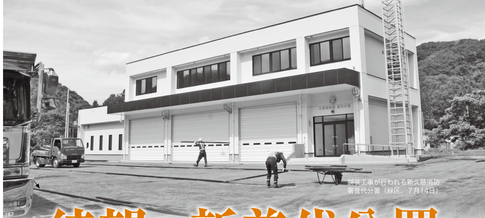
舗装工事が行われる新久慈消防署普代分署（緑区、7月14日）