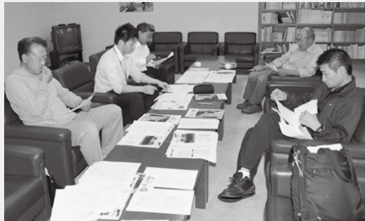
記事の構成を話し合う広報常任委員会。皆さんに親しまれる「議会だより」を目指します！

6月 ▶ 3日・三陸北縦貫道路整備促進期成同盟会総会及び三陸国道事務所への要望（宮古市）▶ 4日・議会運営委員会（役場）▶ 9日・村議会第3回定例会（役場）▶ 26日・村議会全員協議会（役場）、村議会第4回臨時会（役場）