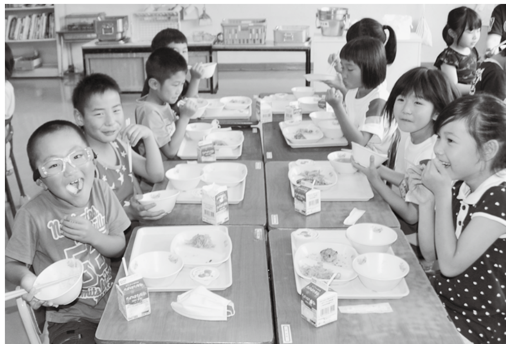
元気に給食を食べる子どもたち (普代小2学年)

普代―向野場線の災害復旧工事測量設計委託料70万円を増額しました。 特別会計では、くろさき荘の屋根の補修に340万円計上しています。