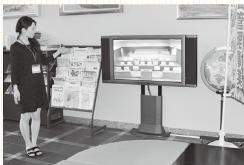
役場1階にあるテレビモニターでは、議会中継を見ることができます

議会定例会は、3月、6月、9月、12月の年4回、役場3階の議会議場で開かれます。議員は議場でどんな発言をしているのか、また、どんな村づくりを考えているのか、今後の村の方向性を直接聞くことができる良い機会です。ぜひ、お越しください。