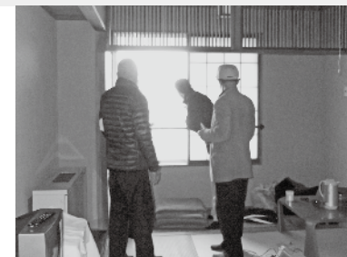
くろさき荘の客室を視察する議員

議会では全議員が早急に現場を視察。バス・トイレ付き4室の選定は次回とし、夏までに全室に冷暖房設備と洗面台を設置することに同意した。