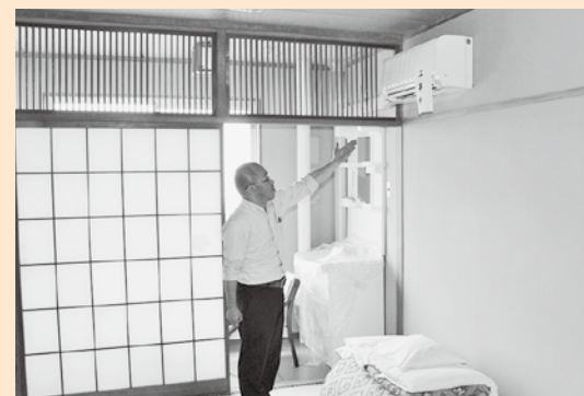
設置済みのエアコンと洗面台

現在、全40室にエアコンを設置し、7月18日から使用している。洗面台は、7月下旬には使用できるように工事を進めている。バス・トイレ付きの部屋の改修については、建物東側（フロントから奥側）の4室を改修予定している。現在2部屋にはバス・トイレがついているので、工事が完了すれば、合計6部屋がバス・トイレ付きになる。現在、設計段階で今年中の完成を目指している。