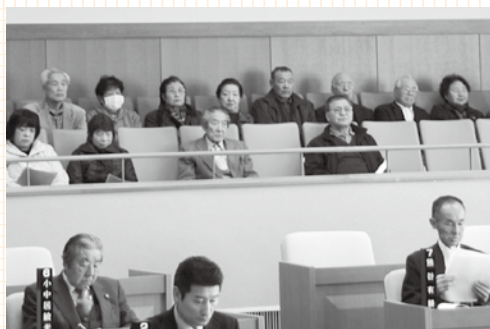
定例会を傍聴する村老人クラブの皆さん