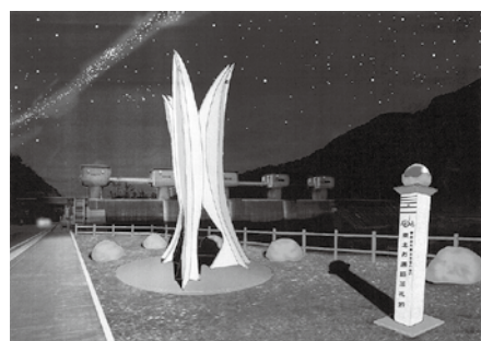
「鮭のシンボル塔」の設置イメージ図

答 影響については、現場から詳しいことを聞いていない。バイク置き場は現在の厨房の下に設置することにする。