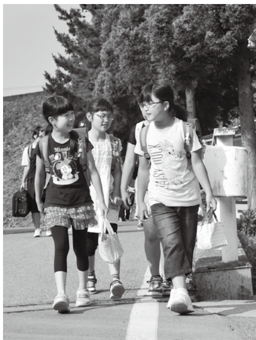
通学路にある銅屋橋も橋梁長寿命化修繕計画の橋として点検が行われる予定です

事業主体は村漁協で、内容はコンブ、小魚など作ちくわ、かまぼこなどを作る研究をしたり、先進地視察、諸材料費などである。村の名産、特産となるよ