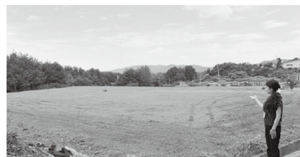
鳥居の給食センター建設予定地 (右奥が「うねとり荘」)