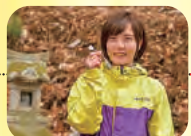
紙でこよりを作って池に投げ、水に沈めば願い事が叶うという場所。