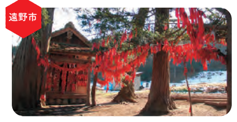
赤い布を左手だけで木に結ぶと願いが叶う、恋愛成就のパワースポットとして名高い遠野市の「卯子酉神社」の自家本元!