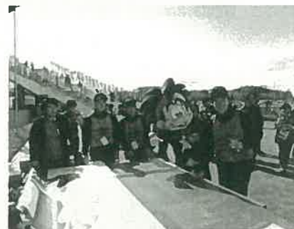
水野ゼミの皆さん

サポーターからメッセージを集めました。メッセージで一杯になったビッグフラッグは、新スタジアムでJリーグ開幕戦が行われる28日(日)、大阪モノレール万博記念公園駅