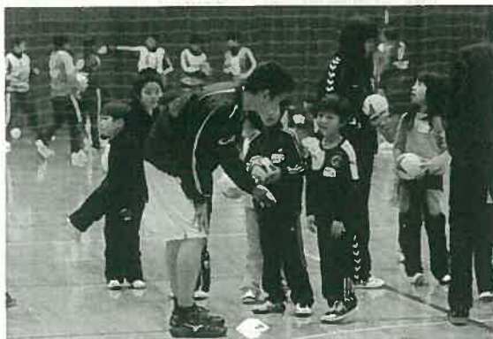
ハンドボール教室

今回は、学友会、学友会体育会、無所属委員会、女子サッカー部、男子サッカー部、女子ラクロス部、ハンドボール部、ReaRhythm、卓球部、洋弓部、バレーボール部、バドミントン部、チアリーダー部、硬式庭球部、漕艇部、