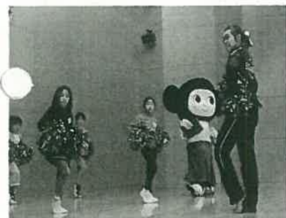
チアリーダー教室（ダンス・コース）

「アーチェリー教室」では関西1部リーグで活躍する強豪の洋弓部が、小学生の身長より長い弓の引き方を丁寧に指導しました。初めて弓を持つて的を凝視する小学生の顔つきが印象的でした。