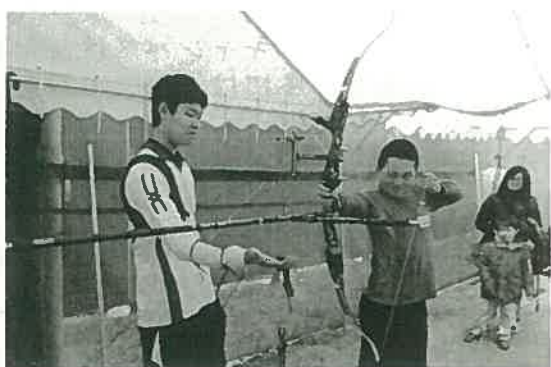
アーチェリー教室

「アーチェリー教室」では関西1部リーグで活躍する強豪の洋弓部が、小学生の身長より長い弓の引き方を丁寧に指導しました。初めて弓を持つて的を凝視する小学生の顔つきが印象的でした。