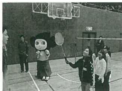
バドミントン教室

いて、うれしかったです。」（卓球教室：3年生）、「バレーボール教室3回目で知っている大学生の人もいて、すごく楽しかったです。今年で終わりですが、バレーボールは続けようと思っています」（バレーボール教室：6年生）、「また、おねえさんといっしょに、おどりたいです。」（チアリーダー教室ダンス・コース：2年生）、「普段ふれた事のないスポーツにトライできて楽しそうでした。初めは緊張した顔をしていましたが、大学生のお兄さんお姉さんがフレンドリーに声かけをしてくれたおかげで、段々表情がかわってきたのが印象的でした。また来年も機会があれば参加してみたいです」（ハンドボール教室：保護者）等の感想が書かれていました。